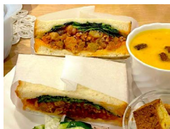
↑3種のスパイス!チリコンカンサンド

ジューナスのお隣に美味しいパン屋さんができました。お隣の「食パン道」さんの焼き立て高級食パンを使ったサンドイッチが登場!! 定番のサバサンドに加え、新メニュー(はチリコンカンサンド!) カフェオーナーによる気まぐれメニューもお楽しみです! 夏に向けての新メニューにも乞うご期待!