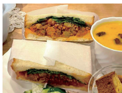
3種のスパイス!チリコンカンサンド

ジェナスのお隣の美味しいパン屋さん「食ぱん道」さんで焼いてもらった、焼き立ての食パンを使ったサンドイッチ。 スープも、これからは冷たいガスパチョをお出します。 デザートには涼しげなゼリーや、アイスクリームやジェラートも?!